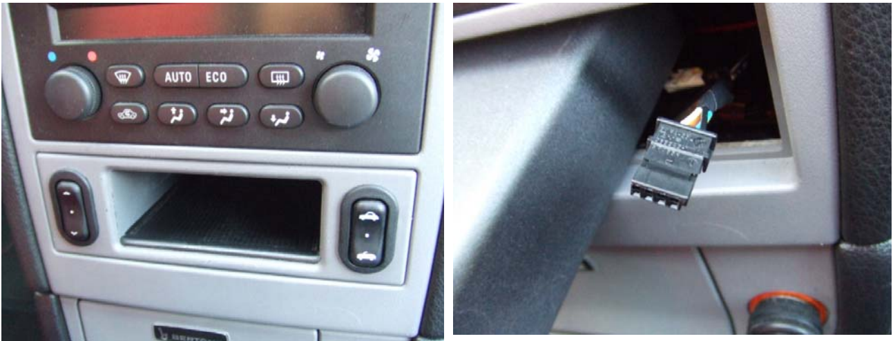
Bild 1: Konsoleneinheit mit Verdeckschalter Bild 2: Stecker Verdeckschalter